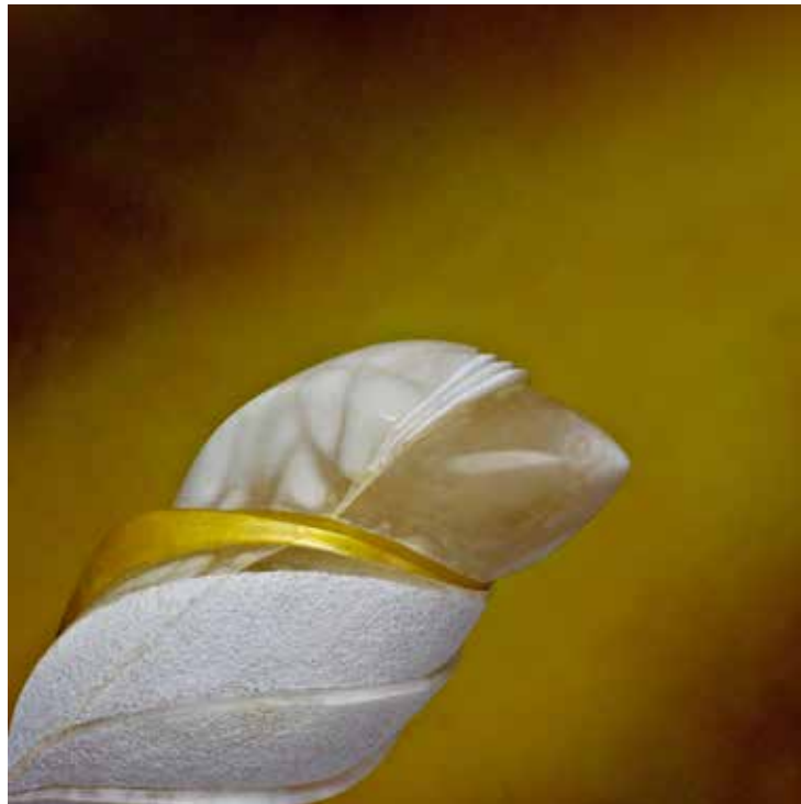
Gold Extrusion 1 (Abstract Series) 2024, stampa su alluminio, cm. 50x50