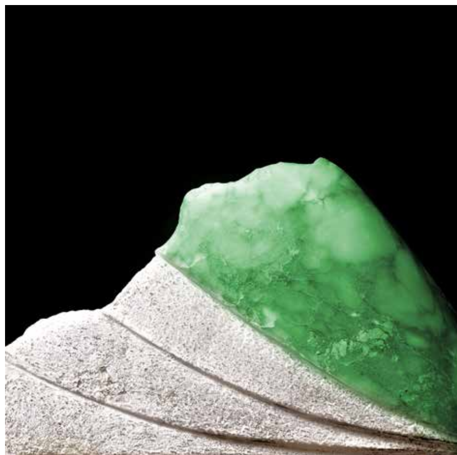
Green 4 (Abstract Series) 2024, stampa su alluminio, cm. 50x50

Nota critica Con la sua opera fotografica, Ceresa esplora l'anima nascosta nelle sculture del Maestro Elvino Motti, creando nuove prospettive visive e citazioni iconografiche, e componendo un immaginario unico e coinvolgente. La sua visione artistica apre le porte all'impercettibile, catturando emozioni e interpretazioni, trasformando così il mondo dell'arte attraverso la fotografia in rappresentazioni personali e uniche.