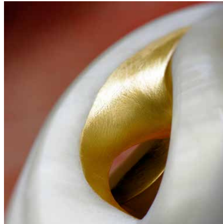
Red Inside (Abstract Series) 2024, stampa su alluminio, cm. 50x50

Nuove prospettive per comporre un immaginario unico e coinvolgente